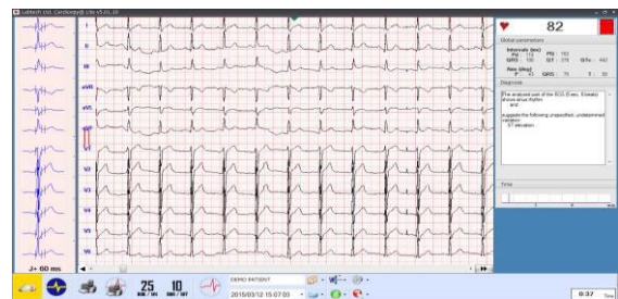
アプリケーションで表示した心電図例