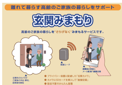
玄関みまもりサービスのイメージ