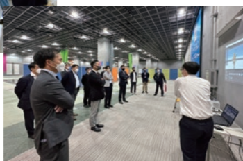
R4.11 視察（けいはんな学研都市）