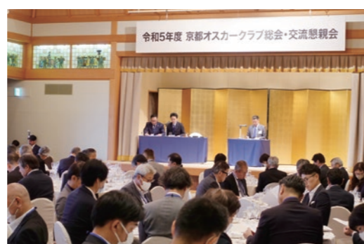
R5.6 総会・交流懇親会