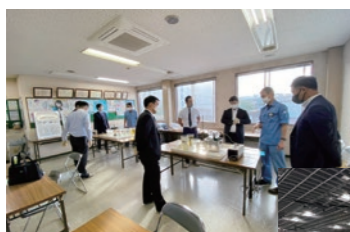
R4.10 職業体験（企業訪問）

京都オスカークラブ会員企業のうち、50歳以下の若手経営者及び次期経営者等で構成しています。会員相互の連携を図りながら、若手経営者等の資質の向上や新たなコラボレーションの創出、現在抱えている悩みや課題の解決に向けて、活動しています。