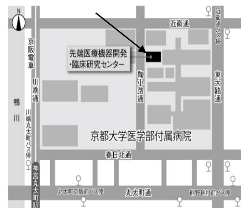
京都市ライフイノベーション創出支援センター