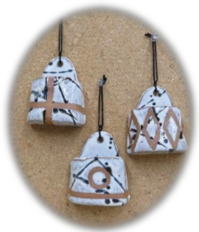
「冬の楽しいを見つけよう！」