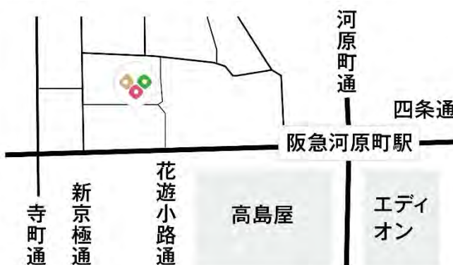
オンラインショップ